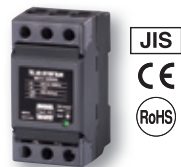
エム・システム技研の並列接続形三相一体形電源用避雷器(形式:MAT2)

以上から、避雷器と耐雷トランスを使い分ける場合、保護効果と導入コストのバランスをとることが必要になってきます。高価で重要性も高く雷サージに弱い製品を保護する場合には耐雷トランスが安心ですし、逆に一般的な電気・電子機器であれば、費用対効果の面で避雷器を使うのが適当だと考えられます。